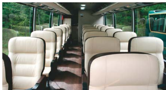
3席8列・24人乗トイレ付 東京・神奈川・千葉発着

座席は、心地よい新型革張りの3列シート。石畳や木目調の床面でもダンな車内。ロール式カーテンでさらに眺望良好です。