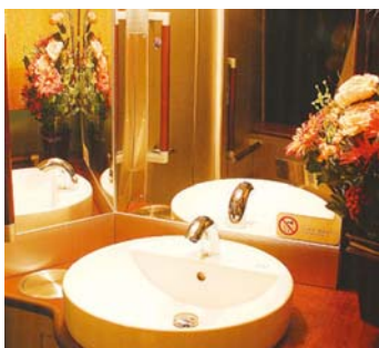
4席8列・32人乗トイレ付東京・神奈川・埼玉発着

薄茶色の木目調床面で落ち着きのあるデザインに。座席前後もゆったり、頭部の高さを調節可。広々とした明るい化粧台付トイレも完備しています。